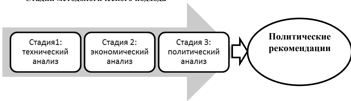
Диаграмма I Стадии методологического подхода

14. Цель этого инструмента заключается в использовании политического анализа для содействия подготовке такого типа и набора стратегий, которые позволят реализовать задачи цели 7 и задачи по сокращению объема выбросов в рамках, определяемых на национальном уровне вкладов. Однако политический анализ требует обеспечивать моделирование энергетических систем для прогнозирования показателей в сфере энергетики и выбросов на период до 2030 года и экономический анализ для оценки того, какие стратегии или варианты будут являться экономически приемлемыми в национальном контексте. С учетом этого предлагается включающая три стадии методология, отраженная в диаграмме I ниже.